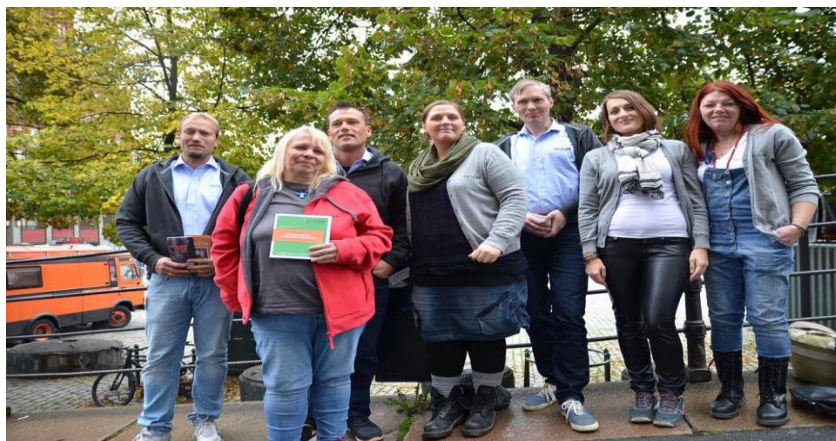
LAR konferanse 2014

Brukerundersøkelsen ble presentert på LAR konferansen i Okt 2014. I 2015 tok vi kontakt med SERAF for å be om hjelp til krysskjøring og analyse. Det ble satt ned en arbeidsgruppe for å arbeide frem et større materiale. proLAR lagde avtale med stipendiat Ashley Lee fra SERAF Des 2015 for utarbeidelse av rapport. Rapporten forventes ferdig sommer 2016.