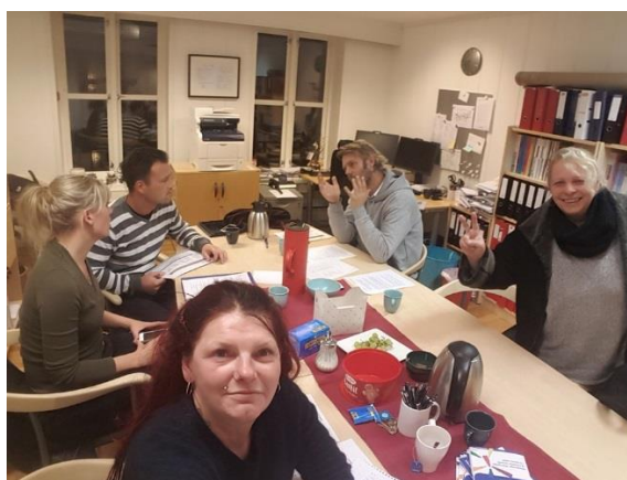
Styremøte på Oslo kontoret