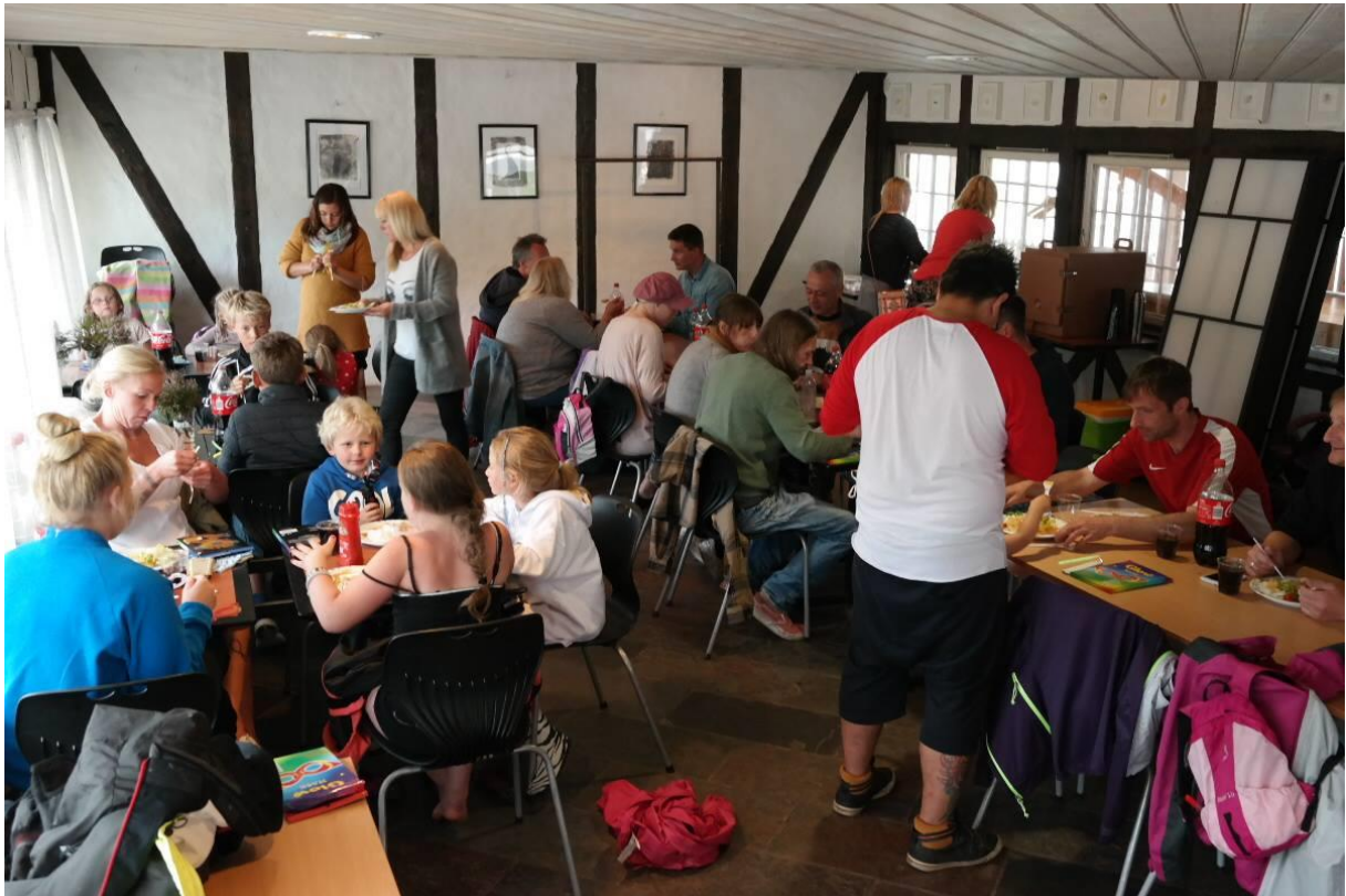
Middag inne en regnværsdag ☺