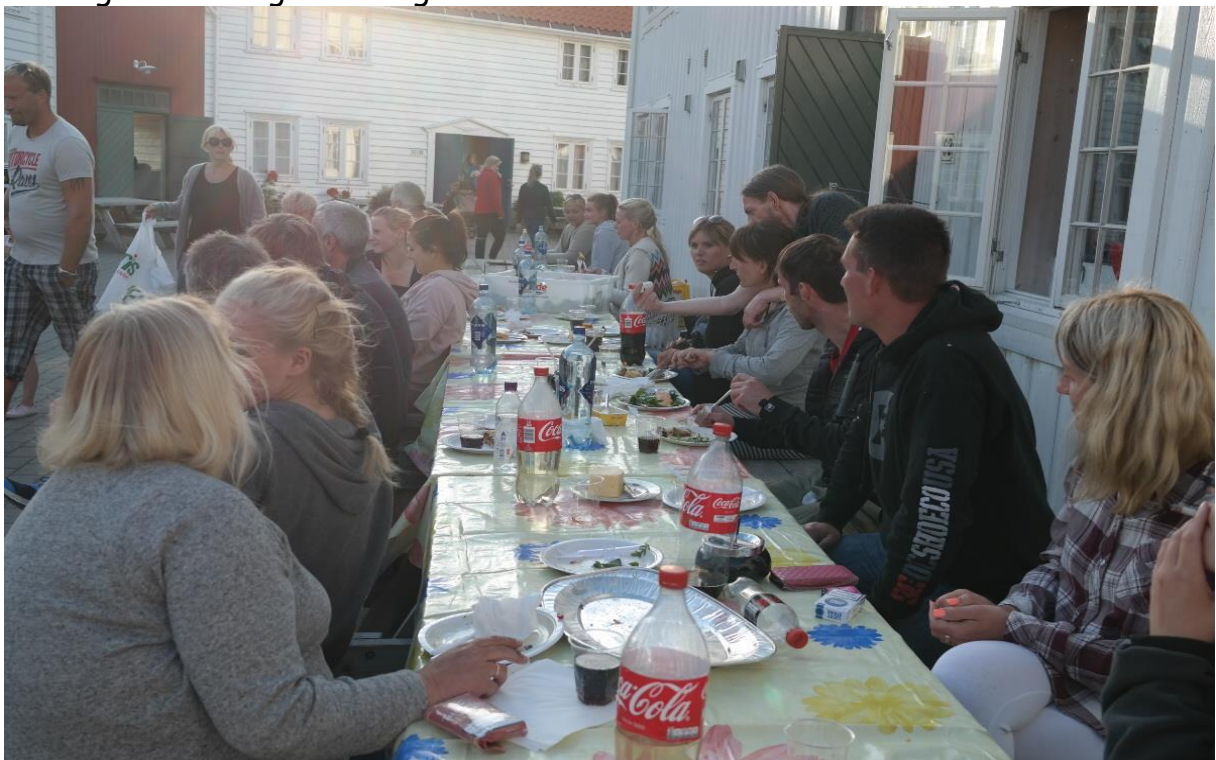
Middag ute en solskinsdag ☺