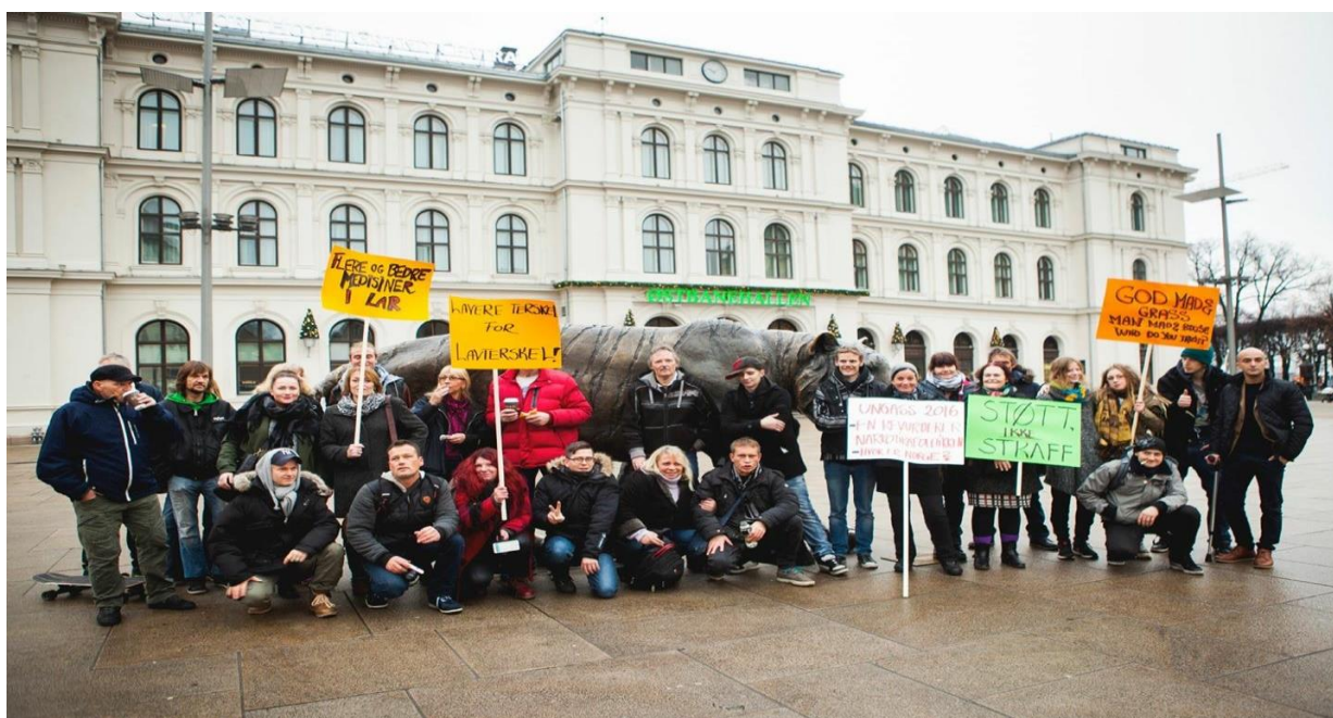
Årets stoffbrukerdag 2015

proLAR var i November 2015 sammen med FHN - Foreningen for en human narkotikapolitikk, på årets Stoffbrukerdag for å be politikere om en ny og mer verdig ruspolitikk for de som fortsatt faller mellom alle stoler.