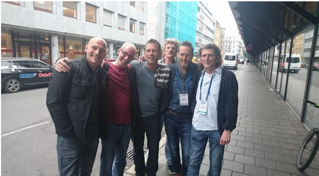
Representanter fra Scotland, Portugal, Norge, Sverige og Belgia. 2016.